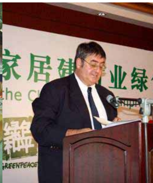
绿色和平组织新闻发布 Greenpeace Press Conference