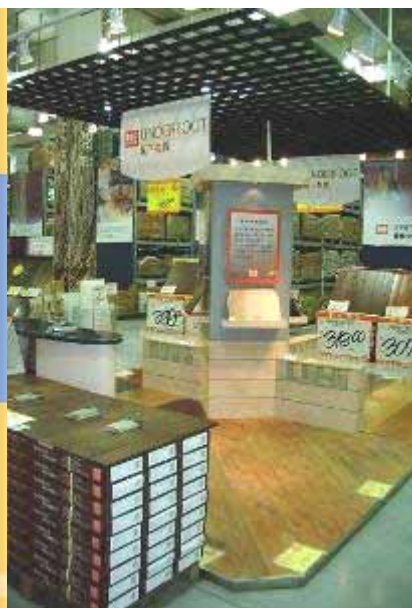
可持续木制品 Sustainable Flooring