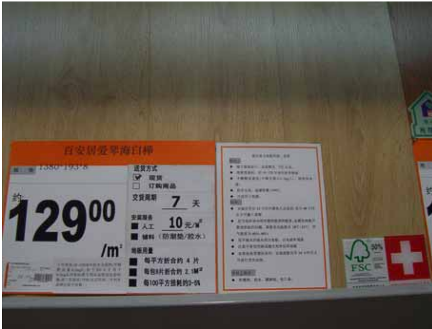
B&Q与KroonSwiss合作的自有品牌