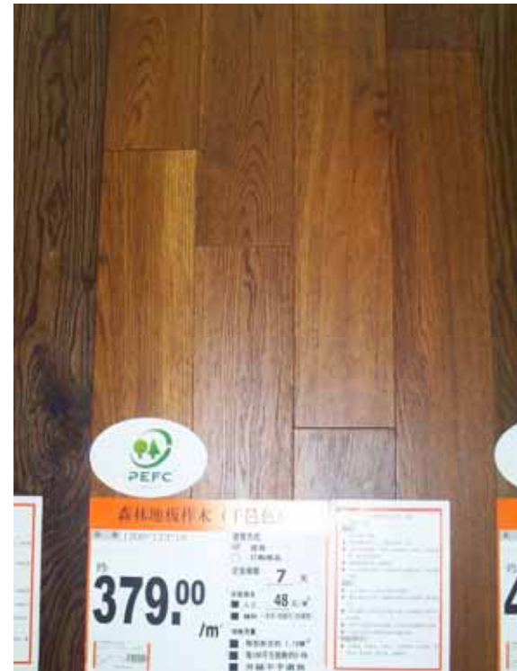
B&Q与China flooring合作的森林地板