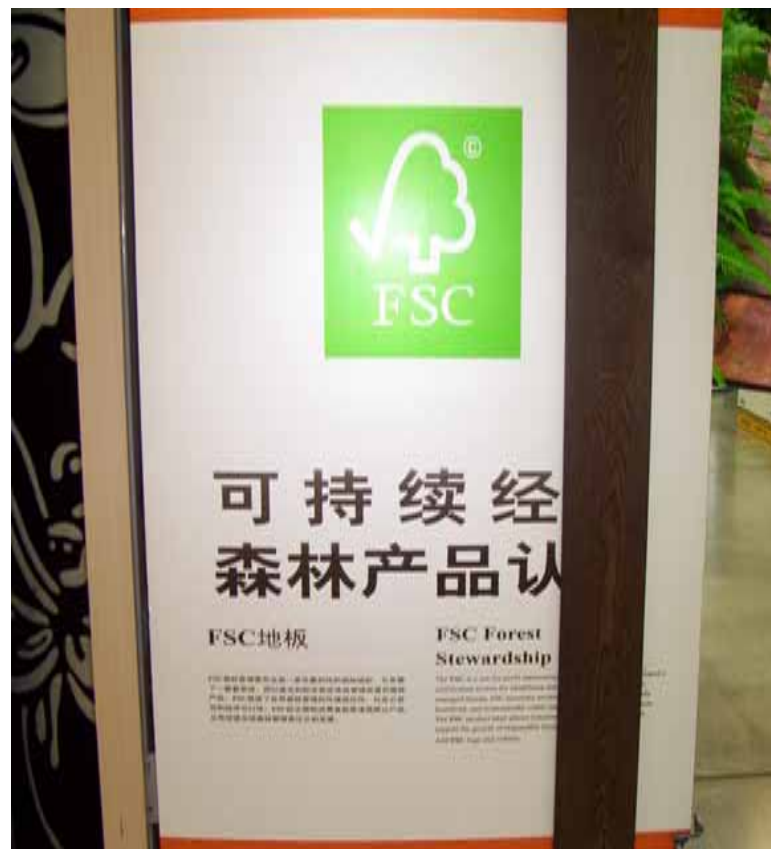
商店地板区对FSC商品的介绍