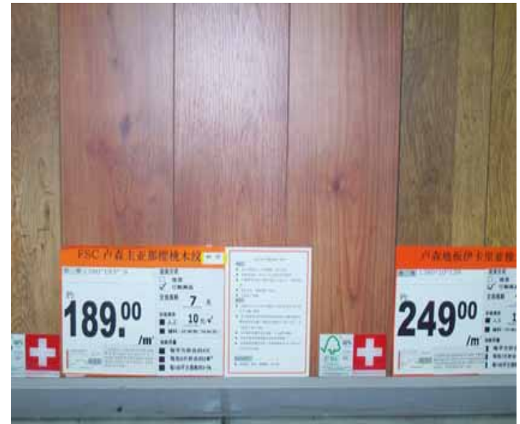
玻利维亚FSC实木地板